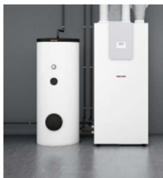
LWZ 5 S Trend-Planungsbeispiel

Die Erwärmung des Brauchwassers und der Heizungsanlage erfolgt über eine Indoor Luftwärmepumpenzentrale mit integraler zentraler kontrollierter Be- und Entlüftungsanlage mit Wärmerückgewinnung, Fabrikat Stiebel Eltron LWZ 5 S Trend oder LWZ 8 S Trend oder gleichwertiger Hersteller mit einem externen 300l Speicher –gemäß Heizlast-und Wärmebedarfsberechnung und moderner Invertertechnologie. Der Verbau erfolgt mit 3 Schalldämpfern, inkl. Werksabnahme und 5-Jahresgarantie. Die Rohrleitungen sind entsprechend des GEG gedämmt. Die Aufstellung eines gleichwertigen Luftwärmepumpenaußengerätes bleibt der KSW für das Raum -und Lüftungskonzept vorbehalten.