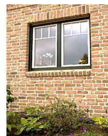
Ansicht mit Sonderausstattung

Die äußeren Fensterbänke, bei einer Verblendfassade, werden als Rollschicht gemauert, wahlweise werden die Sohlbänke der Terrassen- und Außentüren im Erdgeschoss mit Flachklinker belegt.