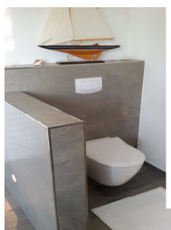
Ansicht mit Sonderausstattung