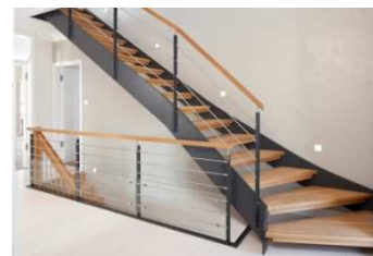
Ansicht mit Sonderausstattung

Handläufe (falls erforderlich) werden wahlweise in Buche farblos lackiert oder geölt geliefert und montiert. Podest - Treppen sind gegen Mehrpreis erhältlich.