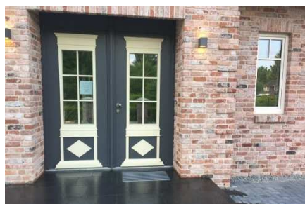
Ansichten mit Sonderausstattung

Nebeneingangstüren (gegen Mehrpreis) werden in Kunststoff in der Farbe weiß (gem. Mustervorlagen KSW) geliefert und eingebaut.