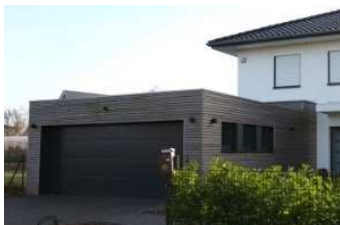
Ansicht mit Sonderausstattung

Es wird eine Deckenbrennstelle mit Schalter sowie eine Einfachsteckdose auf Putz geliefert. Die Absicherung erfolgt über den Sicherungskasten des Hauses.