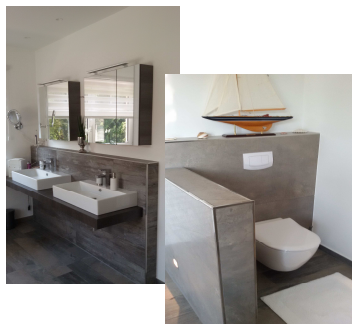
Ansicht mit Sonderausstattung