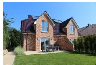
Ansicht mit Sonderausstattung

Der Außenfühler wird durch den Heizungsinstallateur angeschlossen. Die Rohrleitungen sind entsprechend der EnEV gedämmt. Der Gasanschluss wird innerhalb des Hauses ab Gaszähler verlegt. Die Heizungsanlage wird im Haustechnikraum mit einer Direktabgasführung über das Dach installiert.