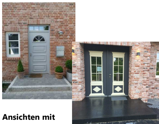
Ansichten mit Sonderausstattung

Nebeneingangstüren (gegen Mehrpreis) werden in Kunststoff in der Farbe weiß (gem. Mustervorlagen KSW) geliefert und eingebaut.