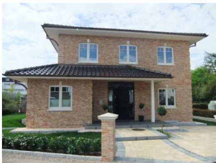
Unsere Musterhäuser in Quickborn & Bönningstedt