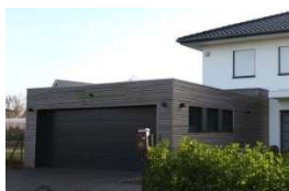
Ansicht mit Sonderausstattung

Es wird eine Deckenbrennstelle mit Schalter sowie eine Einfachsteckdose auf Putz geliefert. Die Absicherung erfolgt über den Sicherungskasten des Hauses.