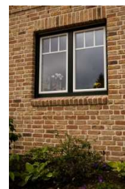
Ansicht mit Sonderausstattung

Die äußeren Fensterbänke, bei einer Verblendfassade, werden als Rollschicht gemauert, wahlweise werden die Sohlbänke der Terrassen- und Außentüren im Erdgeschoss mit Flachklinker belegt.